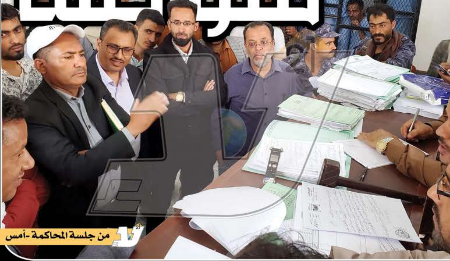
من جلسة المحاكمة - أمس

www.laamedia.net يومية مستقلة سياسية شاملة