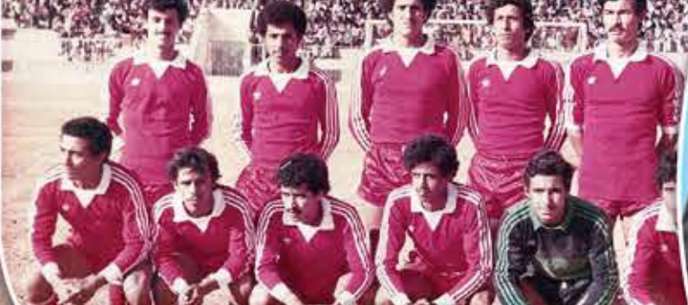
الأهلي، ملعب الظرافي 1980