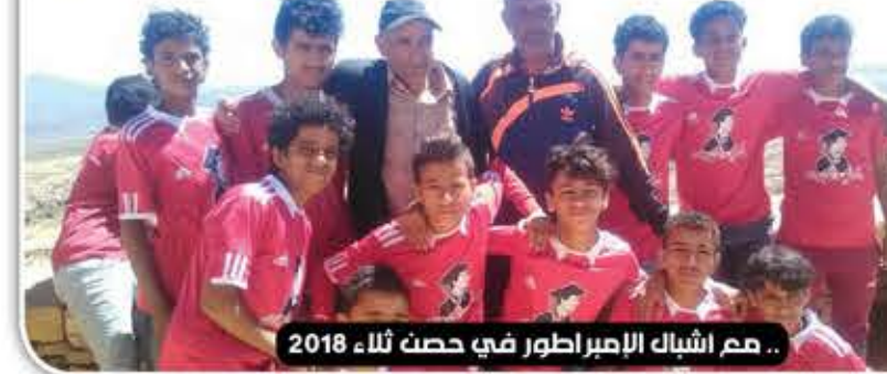
مع أشياك الإمبراطور في حصن ثلاء 2018

دول الخليج لا يوجد بها سوى النفط، ويعيش مواطنوها ببخوثة، بينما اليمن الذي يمتلك كافة الثروات والمقومات من قوة بشرية وزراعية وسمكية ومعديّة ونفطية وغازية يعيش مواطنوه بشكل بائس، وهذا كله بسبب من يكيدون لهذا الوطن ويضرون له الشر لارضاء دول خارجية.