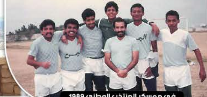
في معسكر المنتخب الوطني 1989