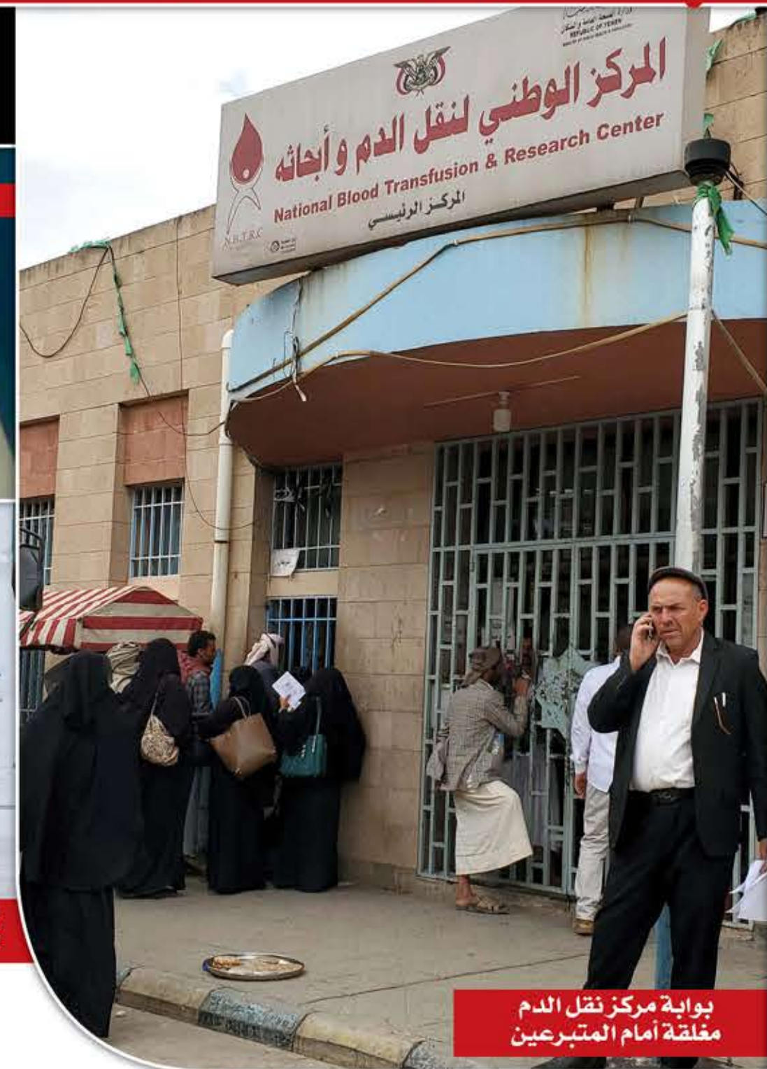
بوابة مركز نقل الدم مغلقة أمام المتبرعين

الأسبوع المنصرم، وبعد ثلاثة أيام من رقدتها في المستشفى لأخذ جرعة «ستزار»، وفقا لوالدها، تعرضت الطفلة لانكساسة كبيرة وانهارت حاد في كريات الدم، مما يستدعي منحها صفائح دم بشكل مستعجل.