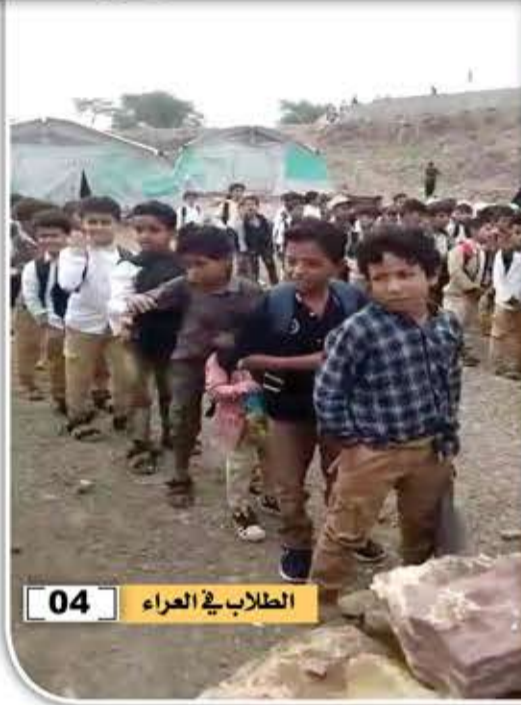
الطلاب في العراق 04