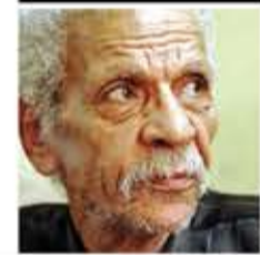
احمد فؤاد نجم

يا قاطع عن بلدي النور ومخلي العتمة بالدور ما تخف علينا يا أخينا مش كل شوية حنثور