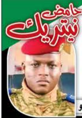
إبراهيم تراوري رئيس بوركينا فاسو

زمن عبودية أفريقيا للأنظمة الغربية انتهى، وبدأت معركة الاستقلال التام. الوطن أو الموت.