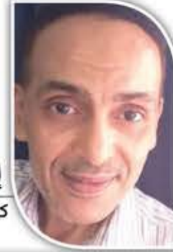
إيهاب شوقي كاتب مصري