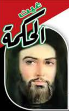
الإمام الشهيد زيد بن علي (عليهما السلام)

حق لمن أمر بالمعروف أن يجتنب المنكر، ولن سلك سبيل العدل أن يصبر على مرارة الحق.