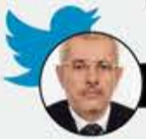
الشيخ حسين حازب

«دنبوع» آخر في النيجر! يا حضرات الثوار في النيجر، لا تكرروا غلطتنا عندما تركنا هادي بعد أن قدم استقالته حتى هرب أو تم تهريبه! خذوا -الزوم- واسكبوه على فته كدم قبل أن يخرج ويعملوا لكم «عاصفة حزم» لإعادة «الشرعية». استفيدوا من تجربتنا، فقد تركنا «دنبوعنا» حتى خرج وحل لغزو واحتلال مازال مستمرا!!