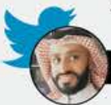
أبا الحسن 313

في كم أهيل في لبنان معول على النظام السعودي لتمويل الحكومة في لبنان وإنقاذ لبنان من الانهيار الاقتصادي. السعودية في عام 2006 دفعت 11 مليار دولار للكيان الصهيوني لشن حرب على لبنان. هل تتوقعون من اللي دفع 11 مليار دولار لتدمير لبنان يدفع كم مليار عشان ينقذ لبنان!!