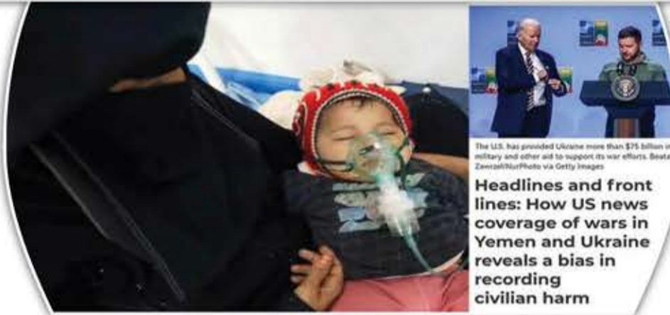
The U.S. has provided Ukraine more than $75 billion in military and other aid to support its war efforts. Headlines and front lines: How US news coverage of wars in Yemen and Ukraine reveals a bias in recording civilian harm

الأمر المختلف هنا هو أن الولايات المتحدة تقف على النقيض بشكل جوهري في الصراعين عندما يتعلق الأمر بعلاقتها مع أولئك الذين يتسببون في أكبر عدد من الضحايا المدنيين. أدلى مسؤولون في واشنطن بتصريحات علنية ومباشرة حول وحشية المجازر في أوكرانيا، بالتزامن مع تجنبهم التحقيق وإدانة تلك المجازر في اليمن. وهنا يقترح بحثنا أن هذه الرسائل للمسؤولين هي في الواقع مدعومة من وسائل الأخبار الأمريكية نفسها.