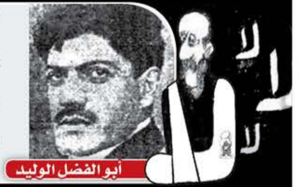
أبو الفضل الوليد

لا تياسوا في ضعفكم وبلاتكم والثأر خلف والوردى قدام إن الخصوم قضاتكم وسلاحهم أحكامهم وجنودهم حكام عجبا! أمنهم تطلبون عدالة بعد التأكد أنهم ظالم؟! من ليس ينصف نفسه متقدماً أزرى به الحرمان والإجحام