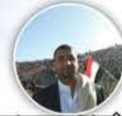
الشيخ نبيل المنفي

المطالب اليمنية محقة ومشروعة، فمن حق الموظف اليمني مثلاً أن يحصل على راتبه من تاريخ توقفه ومن عائدات ثروات بلده التي نهبها المحتل السعودي طيلة ثماني سنوات وأودع بعضها في البنك الأهلي السعودي.