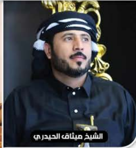
الشيخ ميثاق الحيدري

كانت الطفلة قد اتهمت خالتها بقتل شقيقها الصغرى . وكانت الطفلة علا غانم تعرضت لتعذيب وحشي على أيدي والدها