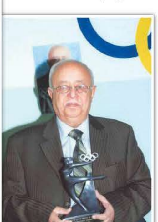
جائزة الأولمبية الدولية

● ما الذي ميز الأندية والرياضة في عهدكم؟