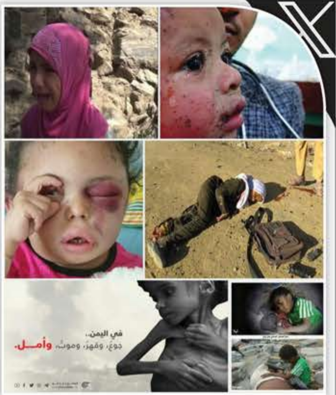
في اليمن.. دوغ، وفهر، وموث، وأمل.

الإنسانية لا تتجزأ، وستظل مظلومية الشعب اليمني المعيار الحقيقي ومقياساً يستدل به على صدق هذه الشعارات الحقوقية الرنانة أمام المجتمع الدولي، الشاهد على زيفها طالما وهناك صمت وخذلان للشعب اليمني الذي مارست وتمارس في حقه قوى العدوان أبشع صور الجرائم والإرهاب.