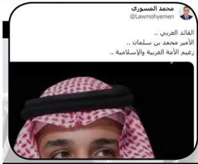
محمد المسوري @Lawmohyemen

القائد العربي .. الأمير محمد بن سلمان .. زعيم الأمة العربية والإسلامية ..