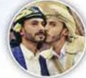
الشيخ محمد صالح راجح