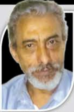
علي نعمان القطري

كانت أسلحتهم تأتيهم من غنائم المعارك أو من الإمداد الجوي من موسكو عن طريق الجو وبالمظلات. وخلال أشهر الثلوج الشديدة حيث تصبح الأرض صلبة، وبعد أن اشتد عودهم على الأرض وصاروا قوة صلبة صنعوا لهم مطارات صغيرة في قلب الغابات المحررة، ووصلت إليهم الكثير من الإمدادات والدعم المطلوب فنيا وصحيا واتصاليا وغيره، فقد أعاقوا تقدم العدو وأخروه وخربوا مجهوداته الحربية وهددوا مؤخراته وخطوط إمداداته باستمرار ومهدوا الطريق والأرضية المناسبة ليشن الجيش الأحمر هجوماته الكبرى لتحرير المناطق المحتلة بشكل نهائي وأنزل بهم هزائم كثيرة جدا وقتل من جنودهم أكثر من مليون جندي بالمضرق وبالإغارات والهجمات المباغتة والضربات الموجهة.