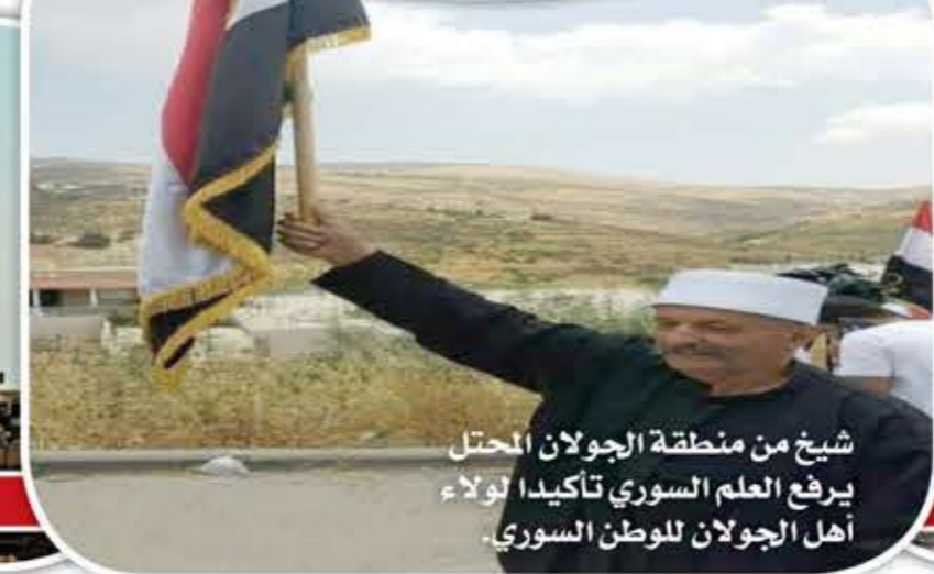
شيخ من منطقة الجولان المحتل يرفع العلم السوري تأكيداً لولاء أهل الجولان للوطن السوري.