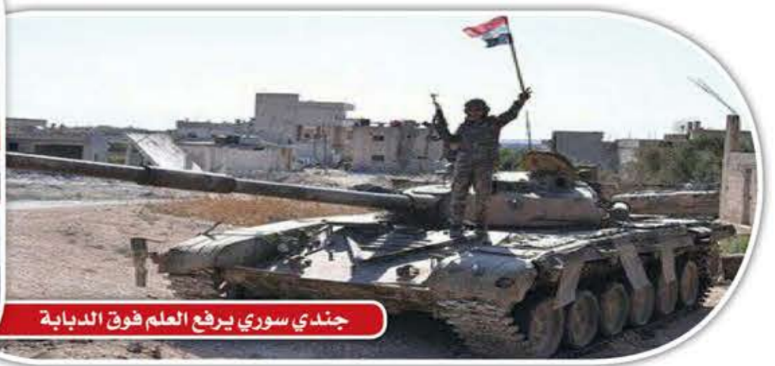
جندي سوري يرفع العلم فوق الدبابة