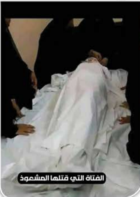
الفتاة التي قتلها المشعوذ

وتشهد المناطق الواقعة تحت سيطرة أدوات العدوان بمحافظة تعز انتشاراً كبيراً للسحرة والمشعوذين الذين يمارسون جرائمهم بحق المجتمع بحماية نافذين ضالعين في العمالة والارتزاق.