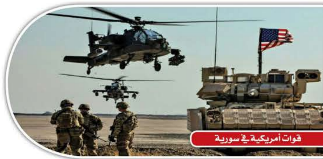
قوات أمريكية في سورية

السيناريو الأول: التحرك شمالاً من قاعدة التنف إلى مناطق سيطرة