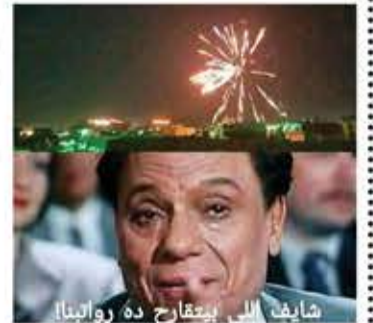
شايف البى بيتقارح ده رواتبنا!

شيخ من شيوخ الرقية الشرعية كمل يقرأ على فتاة عشرينية في العمر، وقال لأهلها إنه أحرق الجنى اللي داخلها، واحتمال تبقى في غيبوبة لمدة أسبوع ويخلوها مغطاية! أهل البنت صدقوا الشيخ وخلوها مغطاية في غرفة لحالها لما ورمت وطلعت ريحتها وشموها الجيران واكتشفوا أنها ميتة. قصة حدثت قبل يومين في حي وادي المدام في تعز. شرطة تعز قالت إنها ضبطت أخو الفتاة وشخص آخر، ومازالت التحقيقات مستمرة!