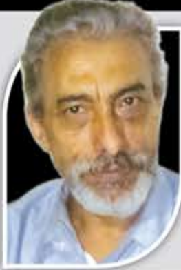
علي نعمان المقطري

تولت القوات الخاصة المصرية تعويض غياب الدبابات والمدافع الثقيلة والآليات في الساعات الأولى للحرب، أي أنها حلت محل أهم القوات العسكرية الأخرى للجيش، التي ما كان يمكن لها أن تتدخل وتشارك إلا بعد فتح الثغرات الترابية، الذي استغرق ساعات طويلة من العمل في الساتر الترابي الضخم الذي كان يحمي العدو بارتفاع 30 متراً عن القناة، فقد تولت القوات الخاصة مقاتلة المدرعات والدبابات الصهيونية التي كانت أكثر من ألف دبابة على أهبة الاستعداد لسحق المصريين وابتلاعهم بلا رحمة إذا فكروا بالعبور، ومع ذلك استطاع الفريق الشاذلي بعبقرية أن يضع خطة لاستخدام القوات الخاصة ويديرها تفصيلاً لتخطي جميع المعوقات أمام العبور بنجاح.