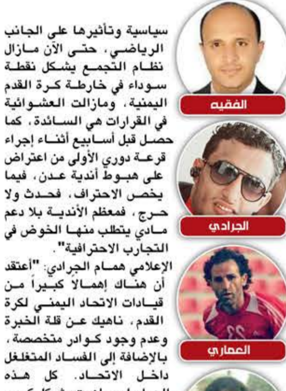
المقيد، الجراشي، الصاصي، السريحي

بين سندان الأمن ومطرقة الاتحاد يسلم عشة، اللاعب السابق في نادي اتحاد إب والحكم الكروي، يقول: "الرياضة اليمنية للأسف بين السندان والمطرقة، بين سندان الحرب والأوضاع الأمنية الداخلية غير المستتية من جهة، وبين مطرقة الاتحاد الذي كان يعمل بعشوائية دون خطط تذكر من جهة أخرى". ويستدرك: "لكن اعتقد أن الاتحاد الآن بدأ بالتصحيح من خلال إشراك القيادات الرياضية التي تستحق في الأماكن المناسبة لها، ونتمنى أن تعود عجلة الدوري كما كانت بنظام الذهاب والإياب، وليس بنظام