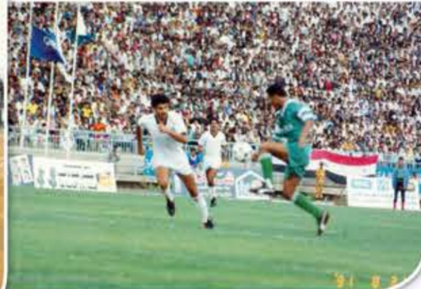
في مكان آخر.