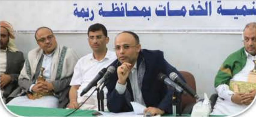
تنمية الخدمات بمحافظة ريمة

ولفت إلى أن من ضمن المشاريع 96 مشروعاً لمسح وشق وتوسعة الطرق، وستة مشاريع في مجال التعليم والصحة و17 مشروعاً في مجال الزراعة ومشاريع المبادرات المجتمعية المرحلتين الأولى والثانية.