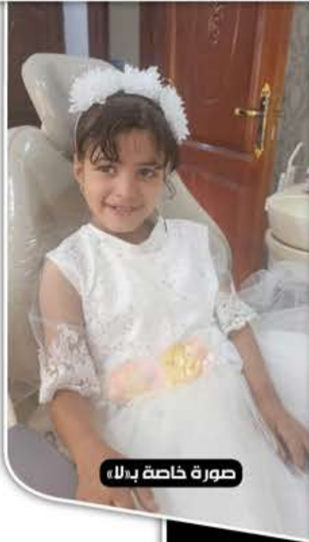
صورة خاصة بـ«لا»

وألقت الأجهزة الأمنية في ريمة القبض على والد الطفلة وأحد الشهود وزوجها، وأحالتهما إلى النيابة الابتدائية بمديرية الجبين، التي بدورها، أحالت ملف القضية مع الطفلة والمتهمين إلى أمانة العاصمة، باعتبارها الاختصاص المكاني لموطن المتهمين الرئيسيين (الأب وزوجته).