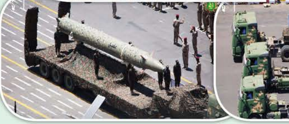
العرض العسكري المهيب للجيش اليمني والقوات المسلحة بمناسبة العيد التاسع لثورة الـ 21 من سبتمبر