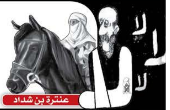
عنترة بن شداد

لا تَقْتَضِي الدَّيْنَ إِلَّا بِالْقَنَا الذُّبُلِ وَلَا تَحْكَمْ سِوَى الْأَسْيَافِ فِي الْقَلْلِ وَلَا تُجَاوِرْ لِنَامَا ذَلَّ جَارُهُمْ وَخَلَّهْمُ فِي عِرَاصِ الدَّارِ وَارْتَحِلْ وَلَا تَفْرَ إِذَا مَا خَضَتْ مَعْرَكَةٌ فَمَا يَزِيدُ فِرَارُ الْمَرْءِ فِي الْأَجْلِ