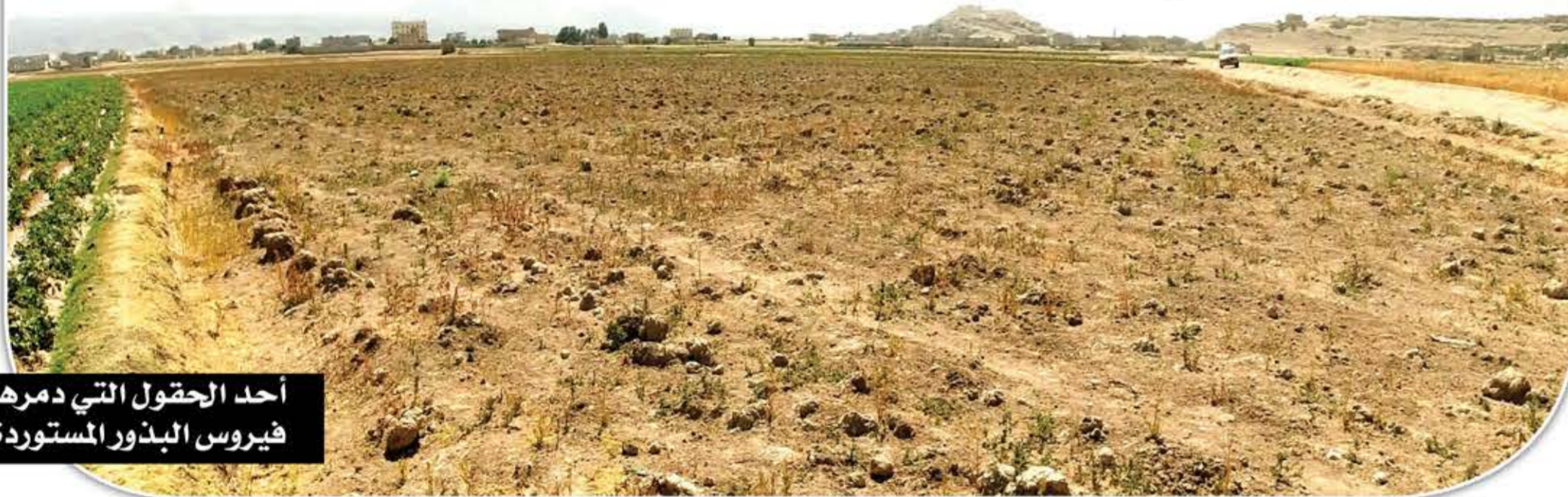
أحد الحقول التي دمرها فيروس البذور المستوردة

يتم استيراد البذور من هولندا وأمريكا وما أثير حول بذور الجزر مجرد مقاضاة أغراض