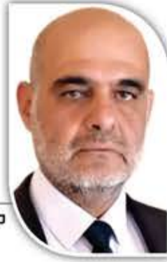
شارل أبي نادر محلل عسكري واستراتيجي لبناني