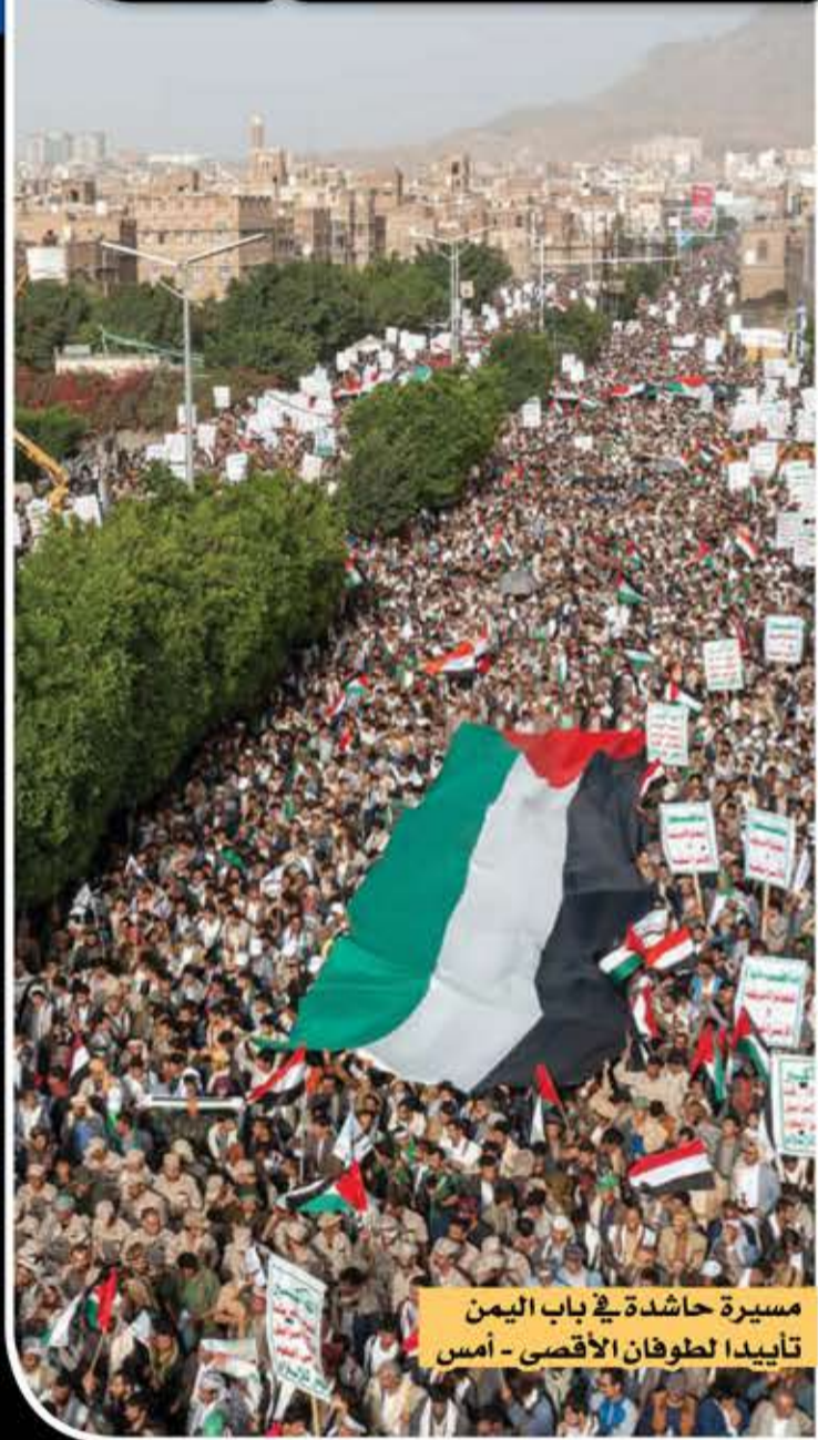
مسيرة حاشدة في باب اليمن تأييداً لطوفان الأقصى - أمس