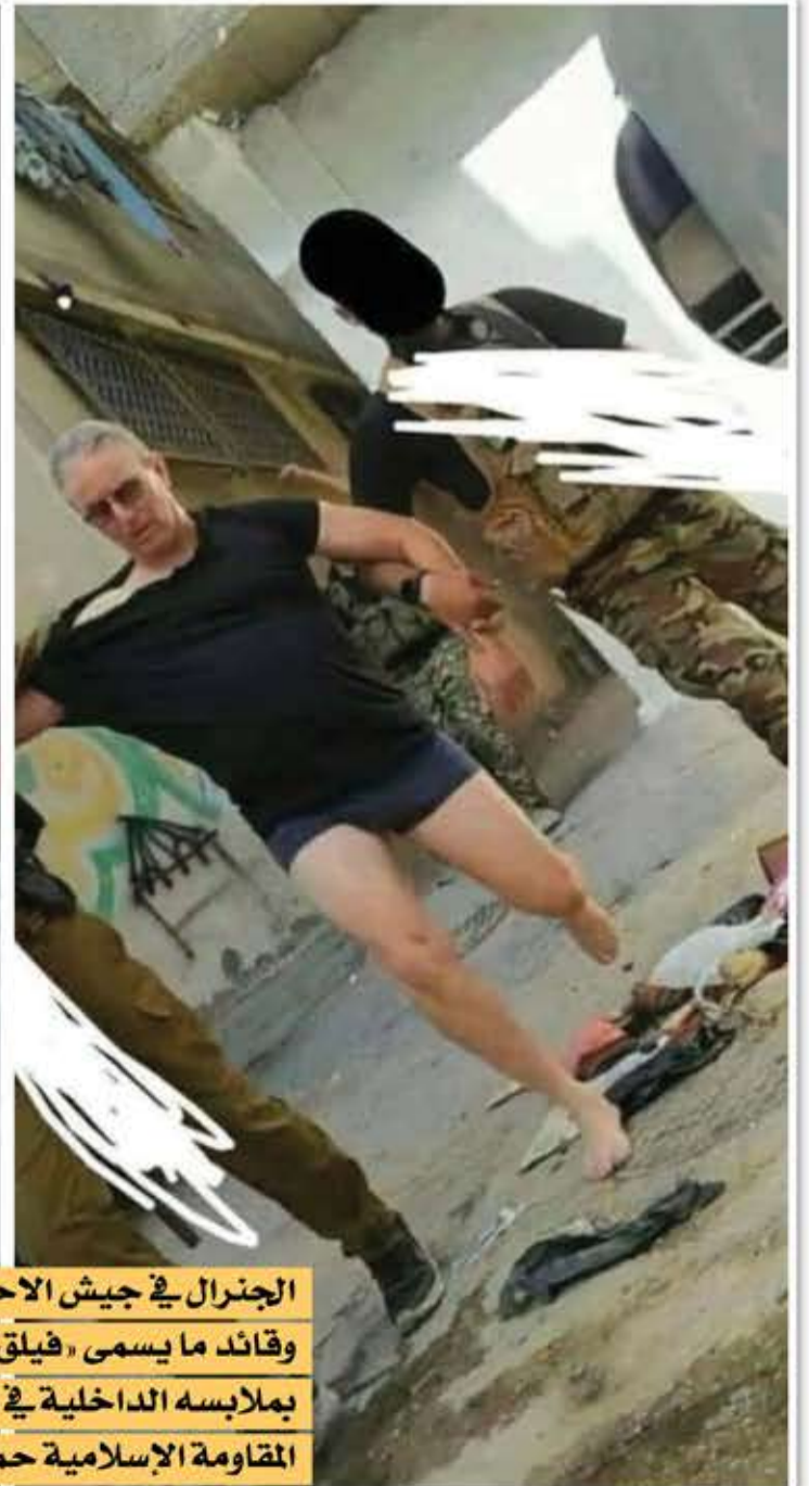
المقاومة الإسلامية حماس.