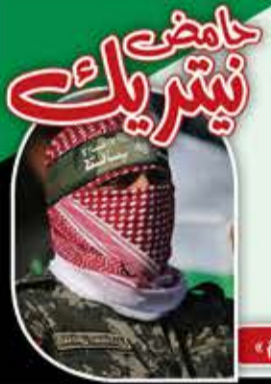
محمد الضيف قائد في «كتائب القسام»

هذا يومكم ليضهم العدو أن زمنه قد انتهى. كل من عنده بندقية فليخرجها، فقد آن أوانها.