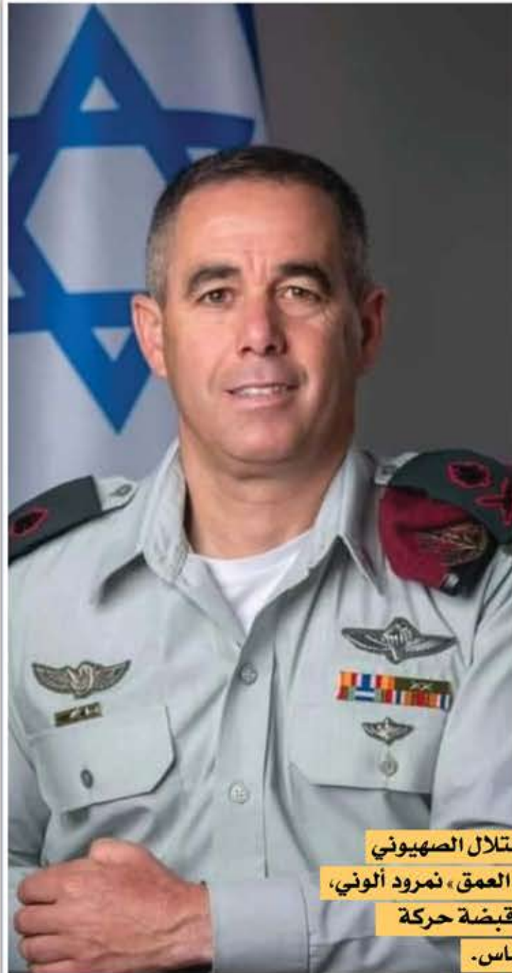
الجنرال في جيش الاحتلال الصهيوني