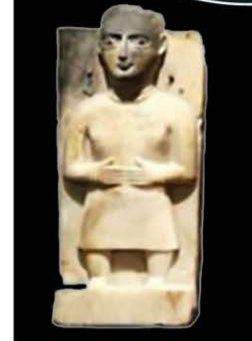
القرن الثاني قبل الميلاد.

وأفاد بأن هذه القطع الأثرية من مقتنيات شلومو موسايف (1925-