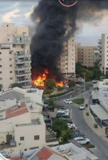
مصدق ما يرى، حيث أحرقت الدبابات الصهيونية وانتشرت جثث الجنود الصهيونية في عشرات الأماكن، منها

والشرطة». وقال إن هناك قائدين كبيرين على الأقل قد قتلوا. وحسب المعلومات فإن مئات من مجاهدي المقاومة تقدموا حوالي 80 كيلومتراً في عمق الأراضي الفلسطينية المحتلة، ودارت المعارك في أكثر من 50 موقعا عسكريا، وتساقطت في يد المقاومة الفلسطينية وسط انهيار غير مسبوق لقوات الاحتلال، واستيلاء المقاومين على قاعدة ما يسمى مقر قيادة «فرقة غزة»، وحصول معارك طاحنة في مواقع «أوفاكيم» و«نتيفوت» و«مشمار هنيغف» و«بثيري» و«سدروت»، وعشرات المواقع العسكرية في المنطقة الجنوبية في قوات الاحتلال. وفي المعارك، التي اشتركت فيها وحدات خاصة وطائرات مسيرة فلسطينية، بثت المقاومة الفلسطينية مشاهد صمت أمامها العالم وحبس أنفاسه مذهولا، غير