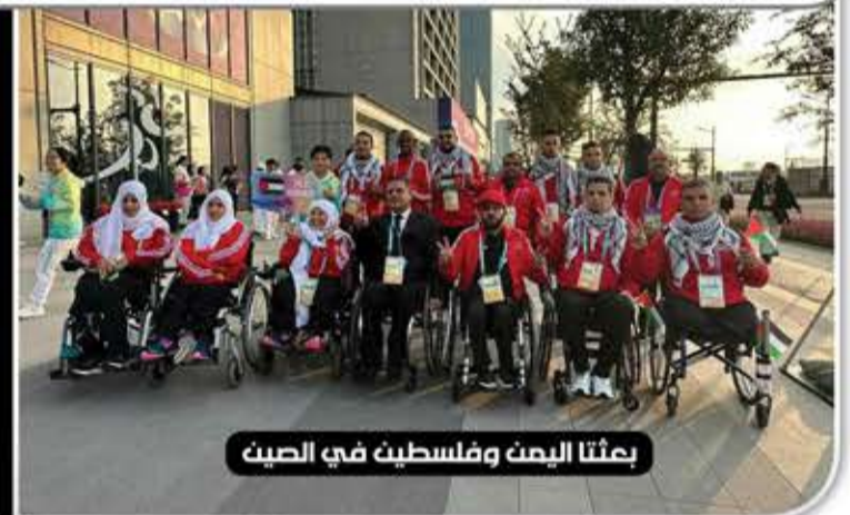
بعثنا اليمن وفلسطين في الصين

تشارك البارالمبية اليمنية في دورة ألعاب الباراسيوية الرابعة التي افتتحت أمس بمدينة هانغتشو الصينية. ويتنافس في الدورة خمسة آلاف لاعب ولاعبة من 44 دولة آسيوية، تضمهم 22 لعبة رياضية. ويخوض البارالمبي اليمني في منافسات 3 رياضات (ألعاب القوى، رفع الأثقال، جودو إعاقة بصرية)، وذلك على النحو التالي: