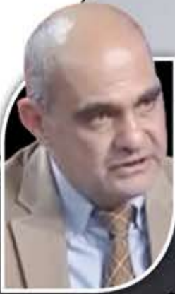
شارف أبي نادر محلل عسكري واستراتيجي لبناني

لا شك في أن ما تعيشه «إسرائيل» اليوم على خلفية «طوفان الأقصى» الذي مازالت تداعياته تنخر ذلاً وخسارة في صميم وعمق وجدان العدو، هو مستمر في مسار متشعب وواسع. أولاً، لناحية الاشتباك مع المقاومة الفلسطينية في غزة وعلى حدودها مع الغلاف والمستوطنات، على صعيد الأعمال القتالية المباشرة، وأيضاً على صعيد مناورة التدمير والإجرام غير المسبوق الذي تمارسه «إسرائيل» متجاوزة كل القيود القانونية والإنسانية المعروفة.