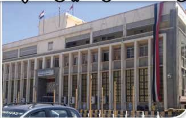
الرئيسي لتردي الأوضاع هو عدم وجود إدارة

ورأت النقابة أن بنك عدن بإمكانه أن يتخذ حلاً سهلاً للحفاظ على أسعار الصرف واستقرارها، إلا أن البنك "لا يريد ذلك" حسب بيان النقابة.