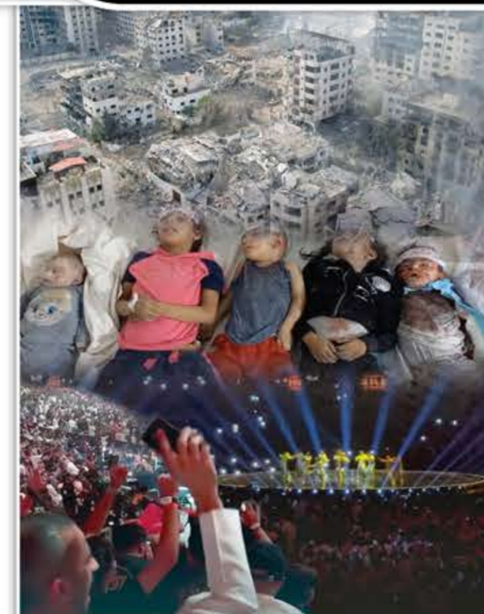
وقال: "لم أركرة القدم توقفت مثلاً، وأي وظيفة حرة وشريفة، وأي وظيفة سياحية أيضاً"، معتبراً

ورد آل الشيخ على "مسخرة" استخدام اسم السعودية في أي شيء، حسب تعبيره، مهاجماً، في منشور على حسابه الرسمي في منصة "فيسبوك"، المطالبين بالغاء موسم الرياض.