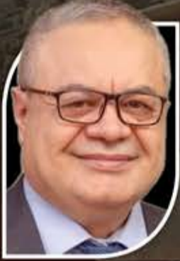
أحمد الدرزي كاتب سوري