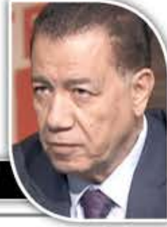
أحمد عز الدين كاتب مصري