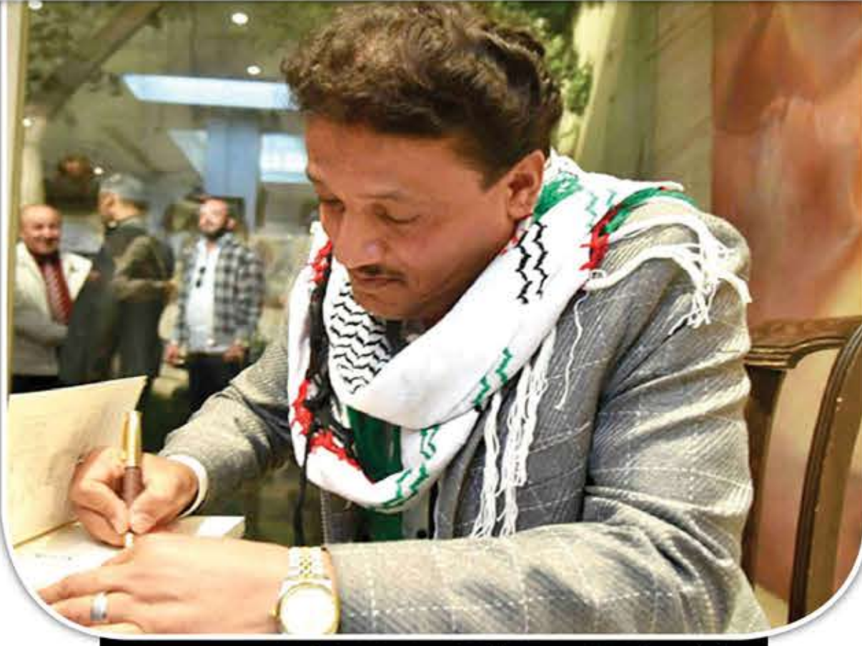
«تشرين» السورية - لمحى بدران

قبل أن نبدأ بقراءة المضمون الشعري، صورة لا تتعد عن السيدة العذراء في احتضانها السيد المسيح، بل تستلهم من تلك الأيقونة الكثير، والذي يشي بمضامين المجموعة. وبعد الانتقال إلى المضمون سنلاحظ كمية الفقد والألم التي ينقلها الشاعر لنا، فهو يُعبّر بكلماته عن يتمه وشوقه لوالدته المتوفاة ويعتبرها أبجديته، ويقول على سبيل المثال: