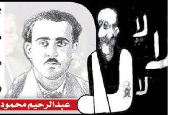
عبد الرحيم محمود

لا تقولوا ما لنا من قدرة إن تريدوا ينخلق عزم وقدرة ما أضر الشعب كاليأس فإن ينس الشعب يكون اليأس قبره هكذا نقضي ولم تبدر لنا غضبة في حقنا أية بادرة وننا ثار على الناس وما نام من يطلب أن يدرك ناره