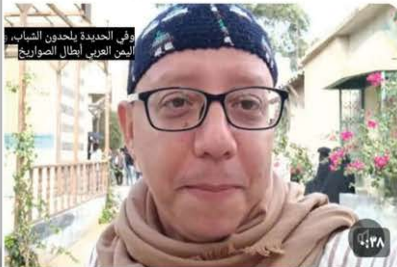
وفي الحديدة يلحدون الشباب، اليمن العربي أبطال الصواريخ

من عبد الحق @mnbdalhq1 ٣١ أكتوبر من باب الحارة إلى باب المنذب..