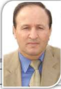
أحمد رفعت يوسف خاص - دمشق

كما توقعنا في مقالنا السابق، فقد شكل موضوع إطلاق سراح القيادي في حركة فتح، مروان البرغوثي، وأمين عام الجبهة الشعبية لتحرير فلسطين، أحمد سعادات، إرباكاً كبيراً للكيان الصهيوني وللسلطة الفلسطينية. وشغل الحيز الأكبر من اهتمامات المتفاوضين، حول إتمام صفقات التبادل بين المقاومة الفلسطينية، وسلطات الاحتلال الصهيوني.