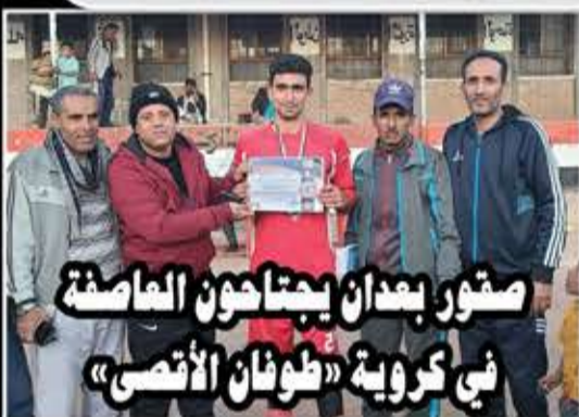
صقور بعدان يجتازون العاصفة في كروية «طوفان الأقصى»