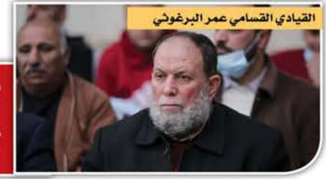
القيادي القسامي عمر البرغوثي

سُئِمَ وحدكم بداية تُرحب بك ضيفة عزيزة على صفحات صحيفة «لا» اليمنية وموقع «لا ميديا» الإلكتروني وبين أشقائكم وأهلكم في يمن العروبة والإسلام.