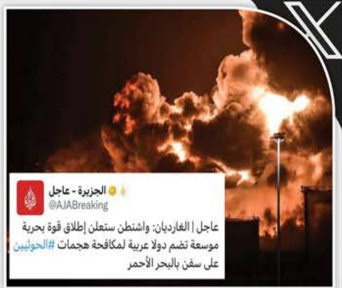
عاجل | الجزيرة - عاجل @AJABreaking عاجل | الغارديان: واشنطن ستعلن إطلاق قوة بحرية موسعة تضم دولا عربية لمكافحة هجمات #الحوثيين على سفن بالبحر الأحمر

المتحمسون من محللين عسكريين وسياسيين لتصديق ما يقال حول قوة بحرية هو ليوودية موسعة يشكلها الأمريكي ضد اليمن: هل يذكرون المشهد الختامي في جدة قبل إعلان الهدنة؟! أشك!!