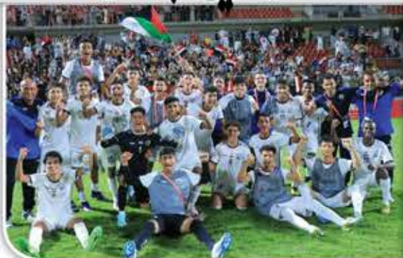
البطولة للمرة الثانية.

واعتبر الرئيس تتويج المنتخب الوطني بلقب البطولة للمرة الثانية في آخر ثلاث مناسبات، دليلاً على تطور الحركة الرياضية اليمنية، ومثل انتصاراً للجبهة الرياضية ويعبر عن المكانة التي يستحقها اليمن واليمنيون.