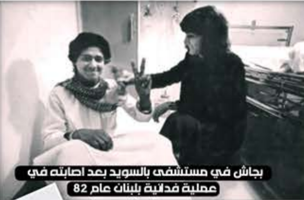
بجاش في مستشفى بالسويد بعد اصابته في عملية فدائية بلبنان عام 82

الجياع لويجي ريغن وبيغن وشارون بانزيدك ياالقضية صرع المرقشي الذي يستذكر أدواره وبطولاته في مواجهة العدو الصهيوني بفخر واعتزاز، يشعر بالحزن والأسى لما تتعرض له غزة من عدوان إسرائيلي، وسط صمت عربي وإسلامي، ولأبناء غزة يقول المرقشي: "الصبر والنصر حليفكم، أنتم منتصرون بإذن الله عاشت غزة وعاش الشعب الفلسطيني والشعب اليمني، اليوم نحن في صراع بين الحق والباطل، والباطل زائل والحق سينتصر بإذن الله".