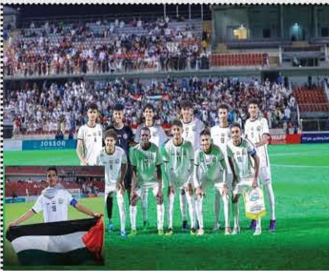
عبد الحفيظ علي محمد عبدالله صالح

هذه الفرحة العارمة بفوز منتخبنا للناشئين تعد استفتاءً آخر على مدى كراهية اليمنيين للسعودية. عدا المرتزقة وهم قلة قليلة. تهانينا لليمن بهذا النصر والانتصارات العسكرية.