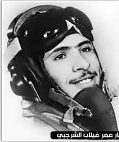
الشهيد البطل الطيار عمر غيلان الشرجي

وحققت "إسرائيل" مبتغاها وأخرجت فصائل الثورة الفلسطينية من لبنان وتم توزيعهم في أماكن شتى في بعض البلدان العربية واستقبلت اليمن الديمقراطية حينها أعداداً كبيرة منهم بطلب من الرئيس علي ناصر، وفتحت لهم المعسكرات التدريبية على أمل العودة لخطوط التماس مع العدو الصهيوني، والتحق الكثير منهم بالدراسة الجامعية وعاشوا كمواطنين يمينيين، بل برعاية خاصة من الرئيس علي ناصر الذي كان داعماً شخصياً طوال فترة رئاسته ومتفاعلاً مع ما قاله الرئيس عرفات إن فلسطين هي الشطر الثالث لليمن.