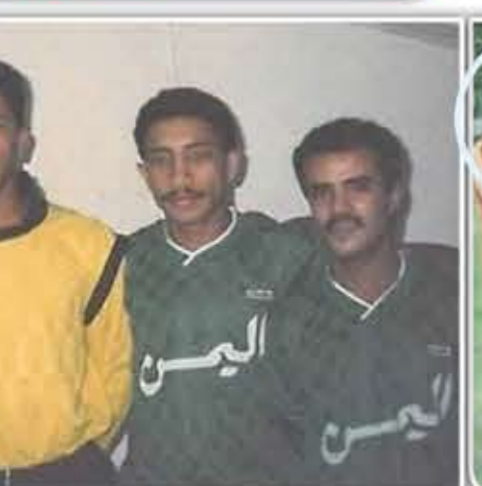
أهلي تعز 1986