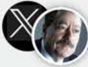
عبد الباري عطوان

نتنياهو يعلن أن محور صلاح الدين «فيلاذلفيا» الفاصل بين مصر والقطاع يجب أن يكون تحت سيطرة جيشه . هذا إعلان حرب على مصر يجب الرد عليه عسكرياً بحشد الجيش، وسياسياً بالغاء اتفاق «كامب ديفيد» . هذا الوقح يجب تأديبه بأسرع وقت ممكن، فمن انهزم أمام حماس لن ينتصر، بل لا يجب أمام مصر .