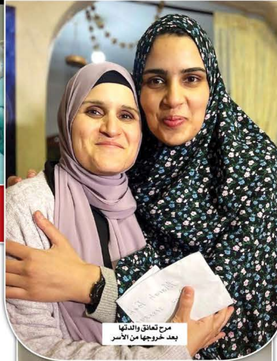
مرح تعانق والدتها بعد خروجها من الأسر

بعد ذلك نقلوني إلى مستشفى «عين كارم»، لأن يدي وذراعي كانت حالتها سيئة جداً نتيجة الرصاصات التي تعرضت لها، فقاموا في اليوم الأول بإجراء عملية لنزع الرصاصات، وطبعاً وسط حراسة مشددة، وبعد ذلك تم نقلي إلى غرفة في المستشفى ذاته، ولكنها فعلياً زنزانة بكل ما تعنيه الكلمة: الحراسة مشددة، والشرطة متواجدة بجوارري على مدار الساعة، الأمر الذي زاد من مستوى الخوف لدي، وكنت