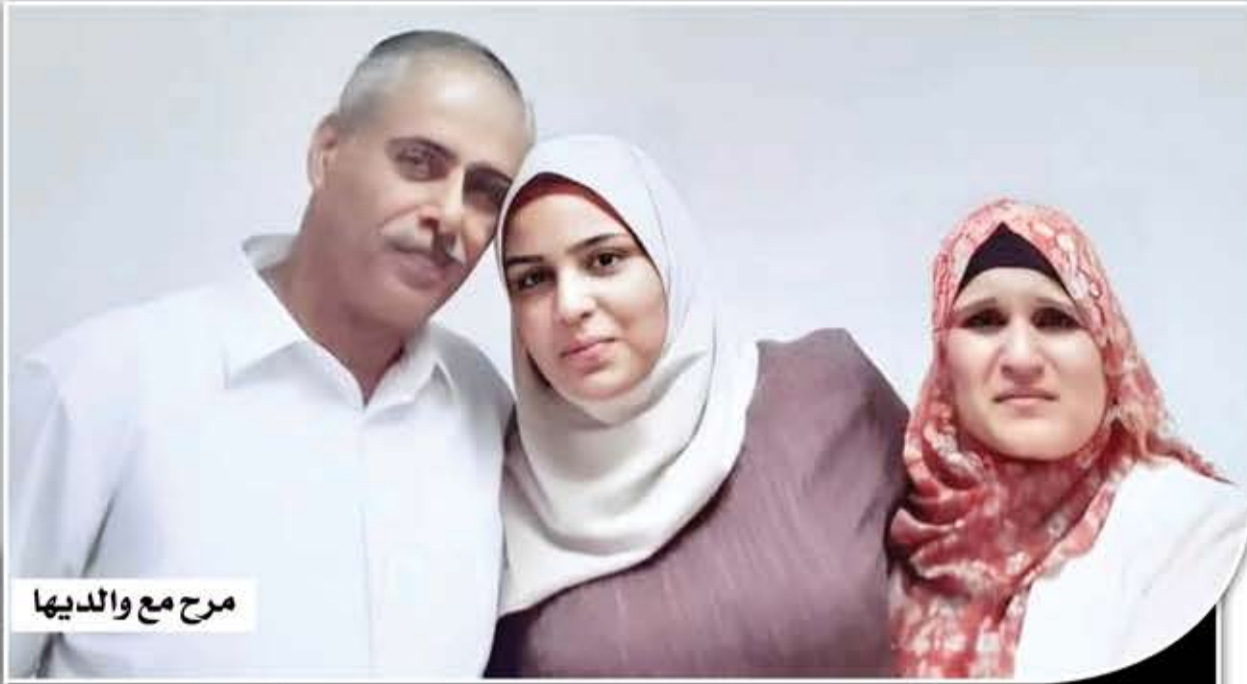
مرح مع والديها