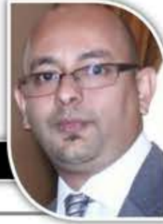
السفير محمد محمد السادة