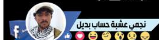
نجمي عشة حساب بديل