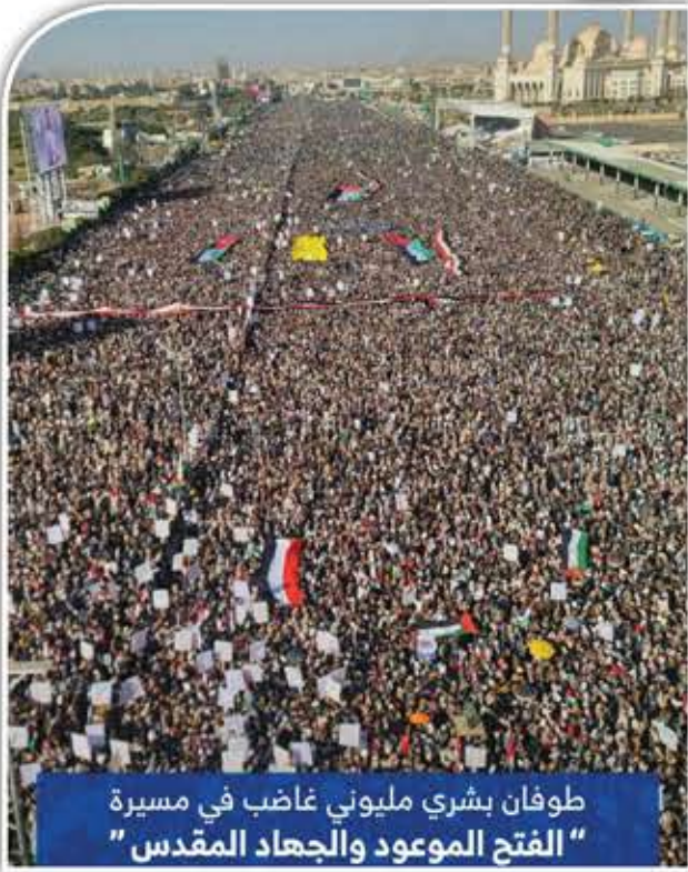
طوفان بشري مليوني غاضب في مسيرة "الفتح الموعود والجهاد المقدس"

وفينا من القبس النبوي مشاعل ضوء تثبت اليقين بأرواحنا في زمان التردد.