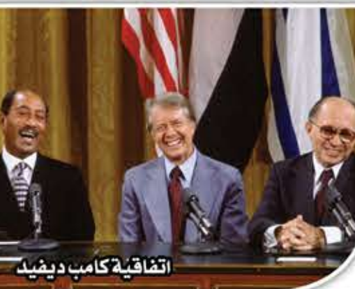
اتفاقية كامب ديفيد