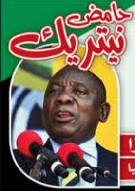
سيريل رامافوزا رئيس جنوب أفريقيا

لن نكون أحراراً ما لم يتحرر الشعب الفلسطيني.