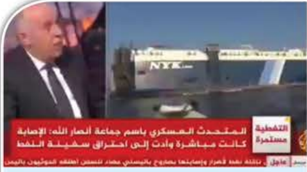
التغطية مستمرة المتحدث العسكري باسم جماعة الحصار الله: الإصابة كانت مباشرة وأدت إلى اختراق سفينة النفط

اللواء فايز الدويري غير قادر على فهم العقل اليمني الذي يدير معركة فك الحصار عن غزة! ربما يعتقد البعض بأن «الدويري» أفضل «ما توصل له العقل العربي في التحليل العسكري الاستراتيجي»، ولكن لا أريد أن أظلمه، ولذا سوف أقول إنه تعود على زمن الهزائم العربية والنكسات، فلذا لا يستطيع أن يتصور تحقيق إنجاز خاص بعقول إسلامية أبدعت من رحم المعاناة والحصار.