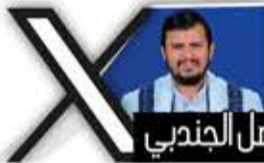
أبو الفيل الجندبي

استهداف التواجد الأمريكي في أي مكان بمنطقتنا العربية هو عمل مقدس وإحسان كبير إلى الأمة كلها. الحرية هي الانتصار على أمريكا. السلام هو هزيمة أمريكا. العدالة هي ضرب أمريكا. تحية وشكر للسواعد التي تنفذ تلك الضربات.