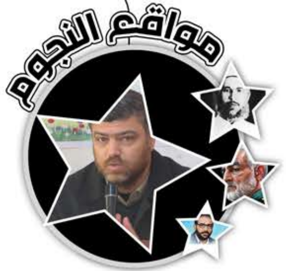
جواد أبو شمالة

واحد من الشخصيات القيادية المؤثرة في الساحة السياسية الفلسطينية، أسهم كقائد اقتصادي قوي ومؤثر، في وضع السياسات لتحقيق التنمية الشاملة المستدامة للفلسطينيين بشكل عام، وتعزيز الاستقلالية الاقتصادية في قطاع غزة بشكل خاص، والتي انعكست على قدرات الحركة في مقاومتها للاحتلال.