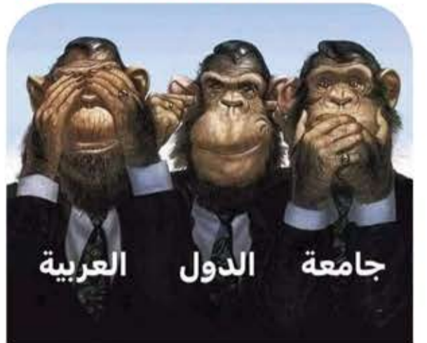
جامعة الدول العربية