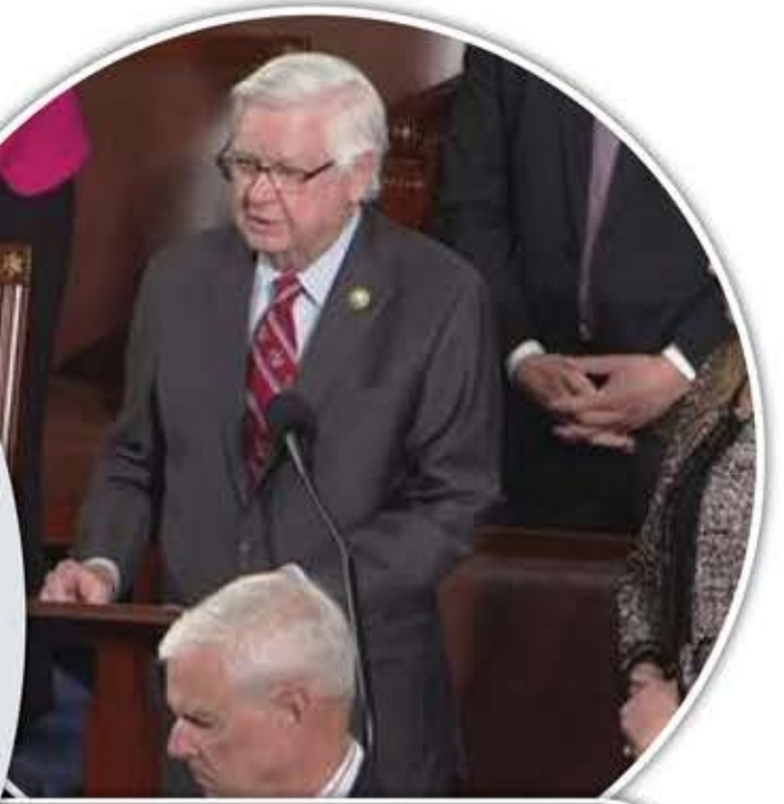
جون ألترمان - الباحث في مركز الدراسات الاستراتيجية والدولية في جلسة استماع عقدتها لجنة الشؤون الخارجية في الكونغرس

الحوثيون على وجه الخصوص ليس لديهم الكثير من القيمة التي يمكن تعريضها للخطر. لقد عملوا من منشآت مؤقتة لعقود من الزمن، وقد تكيفوا مع الحياة بدون غذاء كاف، وماء جار، وكهرباء. جعلتهم ما يقرب من عقد من الهجمات السعودية متمرسين في إخفاء أصولهم والتحرك بسرعة. يقدمون مساحة هدف صغيرة جداً ومن الصعب إعاقة تقدمهم. هم خبراء في إجبار خصومهم على استخدام أسلحة باهظة الثمن لتعطيل أسلحتهم الرخيصة. الولايات المتحدة تنزلق في منحدر زلق من المشاركة العسكرية المتزايدة في اليمن، وهو أمر منفصل عن حجم المصالح الأمريكية هناك. لا أعتقد أن اليمن سيكون «فيتناما» - وهو ما كان عليه اليمن بالنسبة لجمال عبد الناصر المصري في الستينيات، عندما نشر حوالي 70 ألف جندي في اليمن في الستينيات ليضع إبهامه على مقياس الحرب دون جدوى. المعركة في اليمن تعمق الصدع بين الولايات المتحدة والجيوش الشريكة. ومن اللافت للنظر والمثير للقلق في الوقت نفسه أن الحلفاء الرئيسيين في حلف شمال الأطلسي والحلفاء الإقليميين الرئيسيين لا يريدون أي ارتباط علني بأي عمليات عسكرية في اليمن، وحوالي نصف التحالف الدفاعي المكون من 22 عضواً يريدون القيام بذلك سرا.