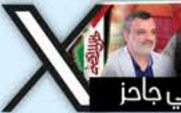
#سيد القول والفعل

لم نعهد عليه أن وعد وأخلف، ولا تحدث وكذب، ولا تحدى وتراجع، ولا برز وانهزم. ولذلك فإن السيد القائد عندما يعدنا ويعد العدو بمفاجآت قادمة، فإنها جاهزة وقيد التنفيذ بإذن الله.