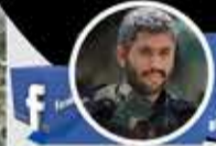
حسين عشيح حساب جديد

من اليمن، ومن ميادين الأحرار، ولن نقول إن صح التعبير، فقد صح وثبت أنها ميادين الرجال الأحرار والواقع يشهد، فما عليك إلا أن تفتح عينيك وتشاهد هذا الخروج المليونى المشرف الذي يرفع الرأس. حفظكم الله يا رجال الرجال، وأحرار وشرقاء الأمة، فوالله لن نكل ولن نمل في حضور الميادين الجهادية، ومع غزة حتى النصر.