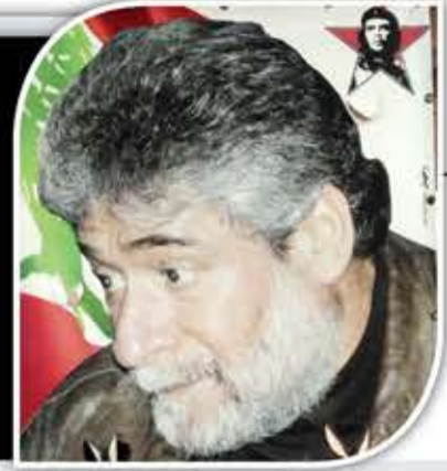
المناضل جورج إبراهيم عبدالله *

« لا يجب أن ننسى أبداً أن التاريخ النضالي التاريخي للشعب الفلسطيني، أي الضدائين، خرج من أحشاء مخيمات اللاجئين في غزة، والضفة الغربية، والأردن، ولبنان. أكثر من أي وقت مضى، فإن هذه المقاومة ضد الإبادة هي ذات الخضرة وتحمل وعد الضدائين» هكذا ختم الأسير في السجون الفرنسية المناضل اللبناني جورج إبراهيم عبدالله بيانه الذي تمت قراءته أثناء تظاهرة تضامنية مع فلسطين أقيمت في مرسيليا الفرنسية في 25 شباط (فبراير) 2024. «الأخبار» تنشر نص البيان كاملاً: