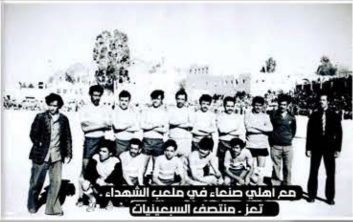
مع أهلي صنعاء في ملعب الشهداء، تعز، منتصف السبعينيات

نادم على لعبي الكرة ومنعت أولادي لهذه الأسباب