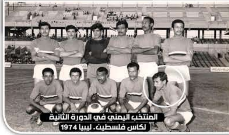
المنتخب اليمني في الدورة الثانية لكأس فلسطين، ليبيا 1974

لعبنا بلا مدربين وبلا إمكانات، ولولا الظروف لاحترفنا في أفضل الأندية العربية