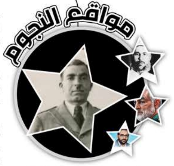
عارف عبد الرازق (أبو فيصل)

المسلحة، وشمل نشاطه السهل الساحلي ويافا واللد والرملة، ووصلت الفصائل التي نشطت تحت إمرته مشارف القدس جنوباً. كان أحد الموقعين على بيان قادة الثورة عام 1938، رداً على بيان وزير المستعمرات البريطاني حول سياسة بريطانيا في فلسطين، وجاء فيه: "لا يرى ديوان الثورة العربية في أقوال الحكومة البريطانية ووزيرها بارقة تدل على حسن نيتها في تحقيق مطالب العرب وميثاقهم القومي. وسيظل المجاهدون يكافحون قوى السلطة الغاشمة، إلى أن تنال الأمة العربية في فلسطين حقوقها كاملة غير منقوصة". كان القائد الوحيد الذي أصدر منشورات مطبوعة باللغة الإنجليزية موجهة للجنود البريطانيين في فلسطين، وأخرى باللغة العبرية موجهة إلى اليهود داخل فلسطين وخارجها. فشلت السلطة البريطانية في القبض عليه. تسلسل إلى العراق، وهناك شارك في ثورة رشيد الكيلاني ولما دخل البريطانيون بغداد فر إلى إيران ثم إلى تركيا ومنها إلى ألمانيا واستقر في صوفيا حيث توفي سنة 1944، مريضاً ولم يعلم أبناء وطنه بوفاته إلا بعد انتهاء الحرب العالمية الثانية.