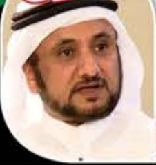
الشيخ حسن بن فرحان المالكي

العودة للنور الكاسف، خير وأسهل من التماذي في العمى؛ فكيف بنور القرآن؟!