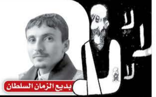
بديع الزمان السلطان

لا عُذْرَ لي غير أسفاري إليك بلا زاد، وقلب كميت ما به رمق وحسن ظنني بربي، إن رحمته ملء السموات تغشى كل من خلقوا يا ربّ بالباب عبد تائب، فمه مستغفر، قلبه بيكي ويحترق وعينه في دموع التوب غارقة وليس أول من في دمعه غرقوا يمد نحوك قلبا ضارعا ويبدأ فقل أعتقتك يا عبدي كمن عتقوا