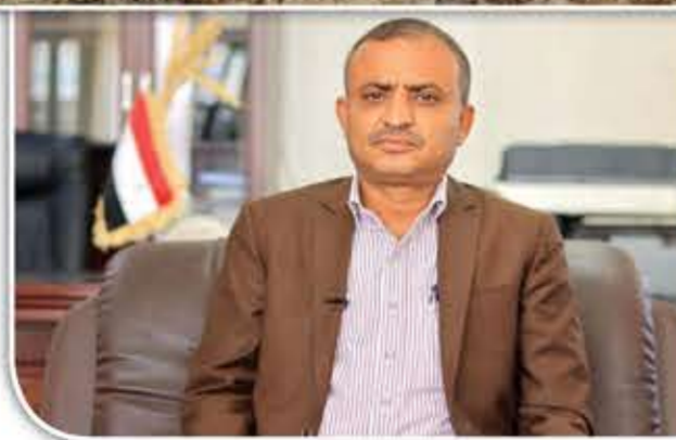
نائب وزير الزراعة: وقرباً 27 حصادة صغيرة و11 كبيرة

سألناه عن عدد الحصادات التي يمتلكها القطاع الخاص وتم استخدامها في الحصاد هذا الموسم، وكذلك الحصادات التي قال إنها ستصل قريباً وتتضم إلى «الأسطول»، لكنه استقل سيارته وغادر مع بلوغ الشمس كبد السماء.