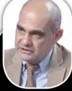
شارك ابي نادر

«لا وجود لحل عسكري خالص لجميع التهديدات المعقدة التي نواجهها في الشرق الأوسط، والذي يمر بوضع غير محتمل وغير مسبق، حيث اليمن يصنع الكثير من الطائرات المسيّرة ولدينا تحديات في ذلك، وهذه المسيرات اليمنية واحد من أكبر التهديدات لأنها غير مكلفة وهي سلاح موجه بدقة».