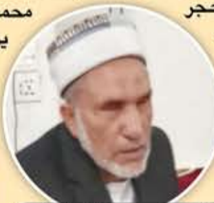
المقرئ يحيى الحلي

ومن حيث نبدأ عبر بوابة حجرية تفتح إلى الصوح الشمسي، الذي ينقسم إلى قسمين: شرقي وتوجد فيه القبة التي تحوي ضريح الإمام القاسم بن الحسين، وجنوبي وهو ممر طويل على جوانبه سبعة عقود من الحجر الأسود، يليه بيت الصلاة، الذي يحمل القبة الشاهقة التي بناها الإمام المتوكل على الله يحيى بن حميد الدين، وتملاً لبيت الصلاة عقود واسعة بنمط العمارة الصناعانية الخالص، حيث الحجر الجيري الذي استخدم والياجور والجص في بناء القباب والعقود، والنقوش الهندسية الجميلة تزين حواف قباب وجدران المسجد بنوافذ الزجاجية