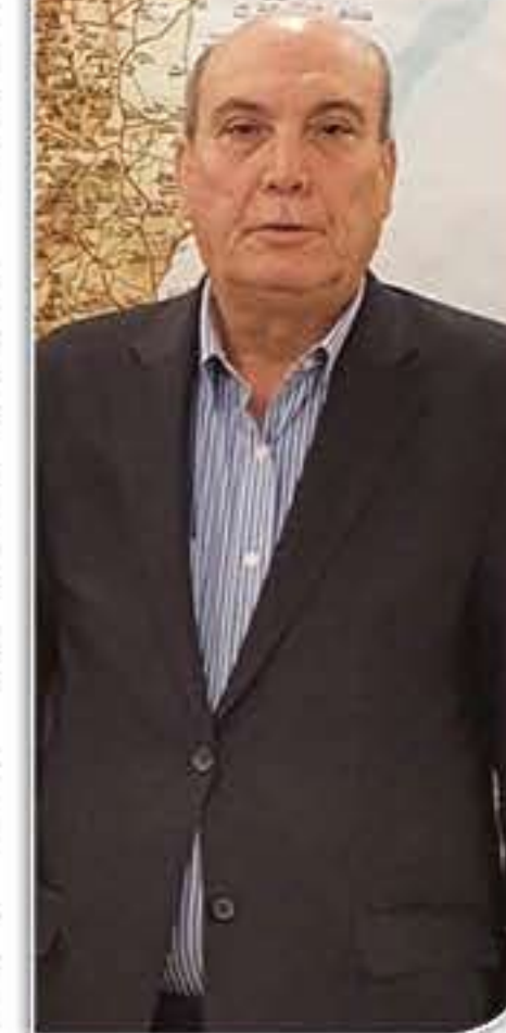
بين «أنصار الله» وفصائل المقاومة في العاصمة اللبنانية بيروت، قال مسؤول العلاقات الدولية في الجبهة الشعبية لتحرير فلسطين: «اللقاء جمع حركة حماس والجبهة الشعبية لتحرير

وأكد القيادي في الجبهة الشعبية لتحرير فلسطين أن «هذا التصعيد اليمني الشامخ والمواقف اليمنية في مجملها والداعمة للشعب الفلسطيني ومقاومته الباسلة، جميعها تشكل نقاط قوة كبيرة بيد الشعب والمقاومة الفلسطينية التي تخوض معركة على الأرض وفي الميدان، وأيضاً تخوض معركة مفاوضات مع العدو ذاته لوقف العدوان وحرب الإبادة، وسيكون لهذه الخطوات اليمنية نتائج عميقة على كيان الاحتلال والولايات المتحدة وعلى كامل صورة المعركة الدائرة على الأرض وفق الطاولات».