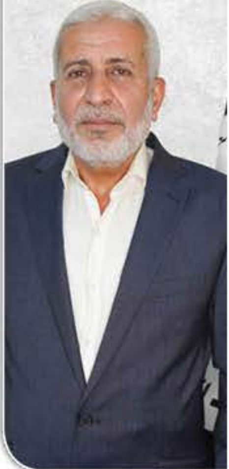
وجه الملاحة الصهيونية عبر البحر الأحمر. وسيؤدي هذا التطور الجديد إلى كارثة اقتصادية ستواجهها حكومة نتنياهو وسيتمد التأثير اليمني ليطال حتى الجانب السياسي ويزيد الضغوط