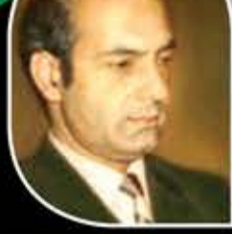
د. علي شريعتي

يمدحون زهد علي عليه السلام، ويأكلون علي مائدة معاوية.