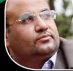
الرئيس الشهيد صالح الصماد

سيأتي نصر من الله يخزي المتخاذلين والقاعدين والساكتين، وسيتمنى كل من سكت وتخاذل لو أنه شارك وقدم شيئاً في إحراز هذا النصر.